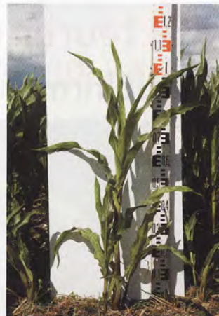
Mit AGROSOL behandelter Mais